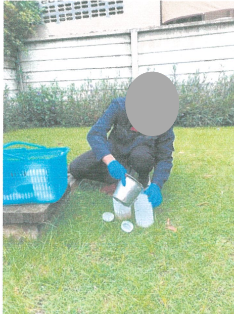
รูปภาพที่ 3.1 การเก็บตัวอย่างน้ำ

การตรวจวิเคราะห์คุณภาพน้ำของโครงการ จัดสรรที่ดิน เดอะ เฟิร์ส ในระยะดำเนินการ ประจำเดือนมกราคม-มิถุนายน 2566 คือ นำผ่านการบำบัด แสดงดังรูปภาพที่ 3.1